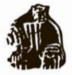
Libreria Jaume de Montsó

Bellver obsequia las aportaciones a La crítica del lector con un libro de regalo. Los lectores que vean publicadas sus reseñas en esta sección pueden pasar por DIARIO de MALLORCA y recoger el bono necesario para conseguir el libro gratis en Jaume de Montsó (P. Joan XXIII, 1B, Palma). Envía tu comentario a bellver.diariodemallorca@epi.es . Máximo 60 palabras. No es necesario que el libro comentado sea novedad.