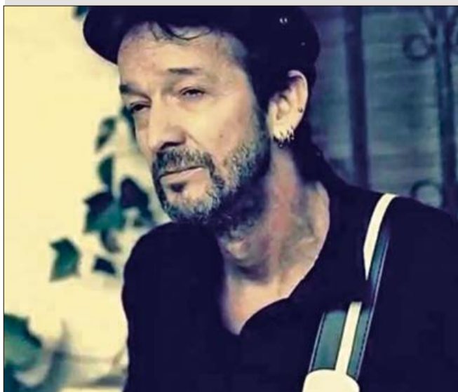
Luis Auserón.

En definitiva la cultura es la esencia de la convivencia, como me apunta un parroquiano en un bar, La cultura es Dios y Eva tomando el sol, lo que nace en tu mente en un silencio de canción... o dos.